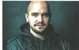
Renato Kaiser spielt im «Casino».

Winterthur Am 30.9. feiert Renato Kaiser Premiere mit seinem Stück «Hilfe» im Casinotheater. Kaiser ist ein Altbekannter im Haus aber auch in der Schweizer Comedy-Landschaft. Der Satiriker und Komiker moderierte die SRF-Sendung «TABU», sorgt regelmässig mit seinen Videos für Furore und ist Preisträger des Salzburger Stiers 2020. pd