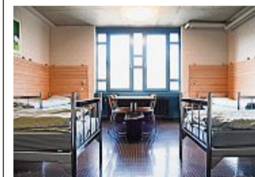
Im Neubau der Kaserne beim Teuchelweiher werden seit Frühling 2022 Geflüchtete untergebracht. Die meisten stammen aus der Ukraine.

Geflüchtete Die Stadt Winterthur hat die Aufträge für Verpflegung, Reinigung und Sicherheit in ihren vier Kollektivunterkünften neu vergeben. Wegen des Kriegs in der Ukraine wurden sie letztes Jahr teilweise sehr schnell in Betrieb genommen. «Aufgrund